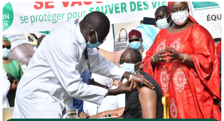
Le Ministre de la Santé et de l'Action sociale prenant la première dose de vaccin contre la Covid-19

La campagne nationale de vaccination contre le Coronavirus a été lancée officiellement le mardi 23 février 2021. Cette vaccination vient compléter les stratégies de prévention de la maladie. A terme, plusieurs catégories de cibles seront vaccinées pour atteindre un bon niveau d'immunisation des communautés permettant la régression de la maladie et un retour à une «vie normale».