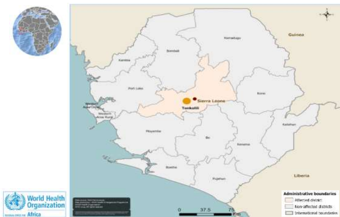
Fig 1: Répartition géographique des cas de fièvre de Lassa en Sierra Leone, 4 - 25 novembre 2019 / Geographical distribution of Lassa fever cases in Sierra Leone, 4 - 25 November 2019.

The health authorities of Sierra Leone notified on 24 November 2019 a new outbreak of Lassa fever in the country (Tonkolili district). The report, based on investigations conducted on 21 November 2019, showed that the first case would date back to 30 October 2019 and came from the Mayorroh community of the Kafe Simira chiefdom in Tonkolili district. At week 47, epidemiological data were 3 laboratory-confirmed cases (including 1 death) and 2 probable cases. The latter died post-operatively on November 04 and would be the starting point for this new outbreak. The 3 confirmed cases are all members of the same medical team that operated the 2 probable cases at Masanga Hospital, Tonkolili District. These are two Dutch nationals (a doctor who died on 23 November and a nurse undergoing treatment in the Netherlands) and a Sierra Leonean woman (an anesthetists nurse undergoing treatment in the lassa fever management unit of Kenema Hospital).