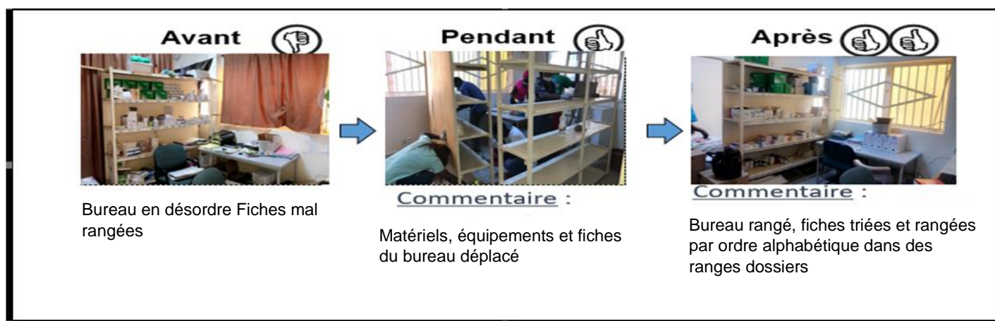
Figure 1 : Résultat de la phase pratique au niveau de la pharmacie IB

Evaluation / Phase de restitution / Elaboration de plan opérationnel