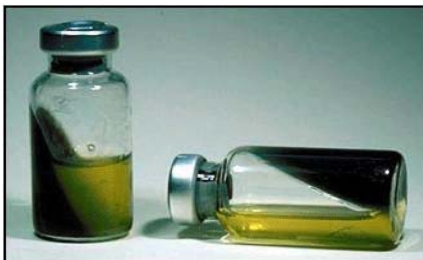
Milieu de transport diphase pour agents de méningite : le TRANS-ISOLATE